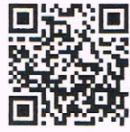
QR-Code เพื่อจองห้องพัก

โทรศัพท์: ๐๒-๔๒๒-๙๒๒๒ E-mail : rsvn@royalriverhotel.com