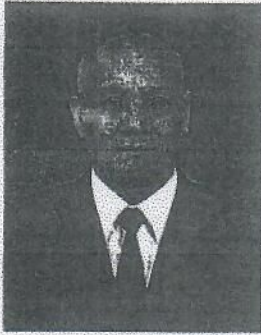
๑๑. พลเอก มโน นุชเกษม ผู้ทรงคุณวุฒิพิเศษ สำนักงานปลัดกระทรวงกลาโหม