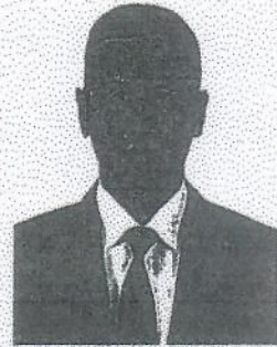
๑๔. พลเอก สุรใจ จิตต์แจ้ง อดีตหัวหน้าสำนักงานกิจการกระจายเสียง กิจการโทรทัศน์ และกิจการโทรคมนาคม กองทัพบก