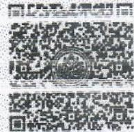
QR-Code เพื่อสมัครอบรม

ชำระเงินโดยวิธีการโอนเงินเข้าบัญชีออมทรัพย์