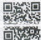
QR-Code เพื่อจองห้องพัก

โทรศัพท์: ๐๒-๕๒๒-๕๒๒๒ E-mail : rsvn@royalrivernotel.com