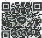
(นายอรรถพล สังขวาสี) เลขาธิการสภาการศึกษา