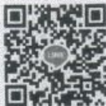
ส่งหลักฐานการโอนเงิน

จึงเรียนมาเพื่อโปรดพิจารณาร่วมทำบุญปัจจัยตามกำลังศรัทธา และขออนุโมทนาในกุศลเจตนาที่ได้ร่วมทำบุญมา ณ โอกาสนี้ พร้อมทั้งขออาราธนาคุณพระศรีรัตนตรัยและสิ่งศักดิ์สิทธิ์ทั้งหลายในสากลโลก โปรดจงบันดาลประทานพรให้ประสบแต่ความสุขความเจริญด้วยจตุรพิธพรชัยและสิ่งอันพึงประสงค์ทุกประการ