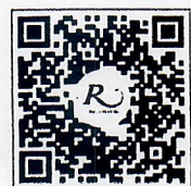
QR CODE สำหรับจองห้องพัก มหาวิทยาลัยศิลปากร

โทรศัพท์: ๐๒-๔๒๒-๙๒๒๒ โทรสาร : ๐๒-๔๓๓-๕๘๘๐ E-mail : rsvn@royalriverhotel.com