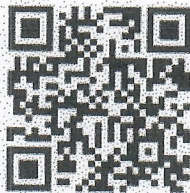
e - Book