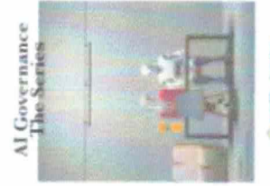
AI Governance The Series VOLUME 3 Welcoming... • 305 |< Share