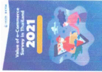
Value of e-Commerce Survey in Thailand 2021 • 601 |< Share