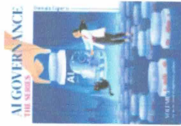
AI Governance The Series VOLUME 5 : Hey doctor, I thi... • 483 |< Share