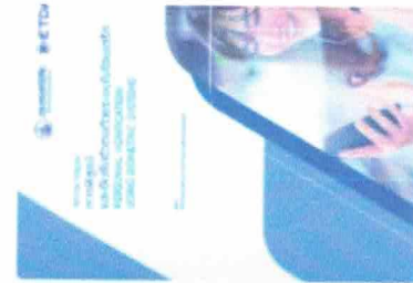
White Paper ทรูดิจิทัล-ขับเคลื่อน ด้วยระบบปัญญาประดิษฐ์ • 1030 |< Share