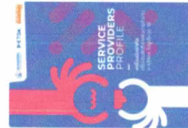
Service Providers Profile • 729 |< Share