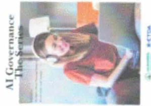
AI Governance The Series VOLUME 4 My Rights : Fro... • 203 |< Share