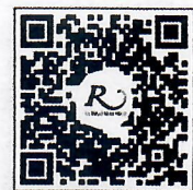
QR CODE สำหรับจองห้องพัก มหาวิทยาลัยศิลปากร

โทรศัพท์: ๐๒-๔๒๒-๙๒๒๒ โทรสาร : ๐๒-๔๓๓-๕๘๘๐ E-mail : rsvn@royalriverhotel.com