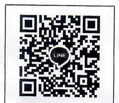
QR-Code เพื่อสอบถามข้อมูล