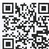
แบบสอบถาม

สำนักงานปลัดกระทรวง สำนักนโยบายและแผน โทร./โทรสาร ๐ ๒๖๒๒ ๒๑๔๘