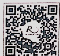
QR CODE สำหรับจองห้องพัก โรงแรมรอยัลริเวอร์

การสำรองห้องพัก ท่านสามารถจองห้องพักกับทางโรงแรมโดยสแกน QR-Code สำหรับจองห้องพัก หากท่านจองห้องพักภายหลังห้องพักอาจเต็มได้ และอาจจะได้ห้องพักราคาพิเศษซึ่งเป็นอัตราค่าที่พัก โรงแรมรอยัลริเวอร์ ๒๑๙ ซอยจรัญสนิทวงศ์ ๖๖/๑ แขวงบางพลัด เขตบางพลัด กรุงเทพฯ ๑๐๗๐๐ โทรศัพท์: ๐๒-๔๒๒-๙๒๒๒ โทรสาร : ๐๒-๔๓๓-๕๘๘๐ E-mail : rsvn@royalriverhotel.com