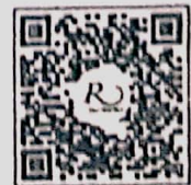
QR CODE สำหรับจองห้องพัก มหาวิทยาลัยศิลปากร