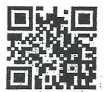
ดาวน์โหลดเอกสาร