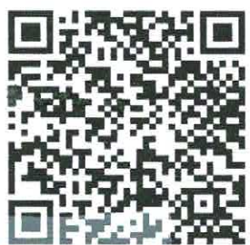
ดาวน์โหลดข้อมูล แสกน QR code

เจ้าพนักงานป่าไม้อาวุโส รักษาราชการแทน ผู้อำนวยการสำนักจัดการทรัพยากรป่าไม้ที่ ๕ (ตาก)