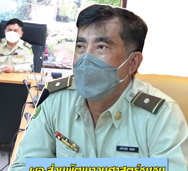
ผอ.ส่วนพัฒนานวนศาสตร์ชุมชน