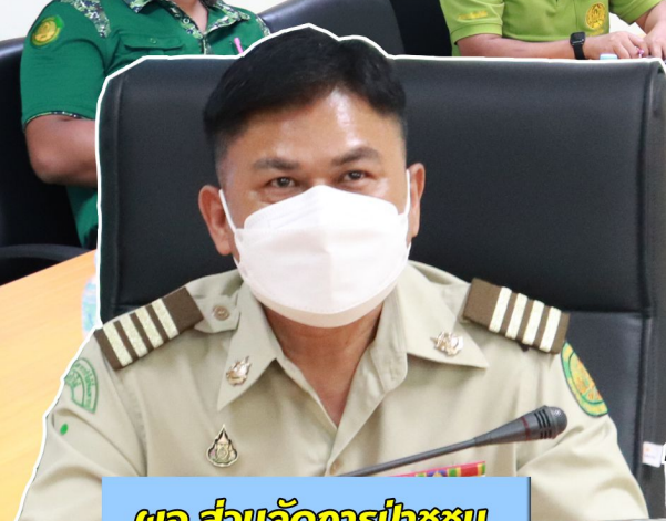
ผอ.ส่วนจัดการป่าชุมชน

กรมป่าไม้ สำนักจัดการทรัพยากรป่าไม้ที่ ๔ (ตาก)