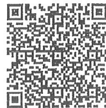
QR Code (3)