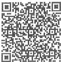
QR Code (1)

สถาบันพัฒนาบุคลากรภาครัฐด้านดิจิทัล กลุ่มงานพัฒนาบุคลากรภาครัฐด้านดิจิทัล มือถือ ๐๘ ๐๐๔๕ ๓๓๔๖ (ทิพย์ศริน), ๐๘ ๐๐๔๕ ๓๓๕๘ (วิระญา) ไปรษณีย์อิเล็กทรอนิกส์สารบรรณกลาง dga@saraban.mail.go.th