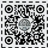
คู่มือการคัดเลือก "แสงดาว"