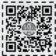
แบบฟอร์มการคัดเลือก "แสงดาว"