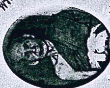
พระบาทสมเด็จพระมงกุฎเกล้าเจ้าอยู่หัว