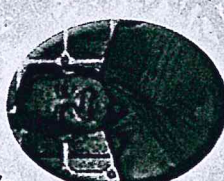
พระบาทสมเด็จพระปกเกล้าเจ้าอยู่หัว