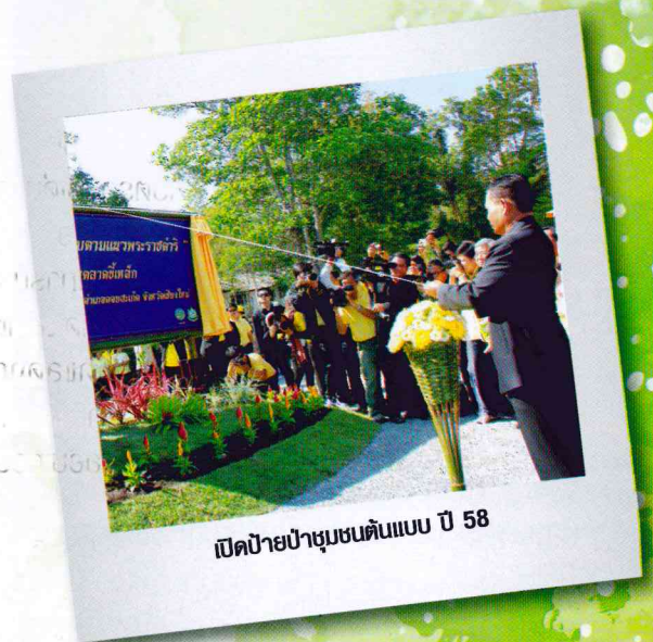
เปิดป่าชุมชนต้นแบบ ปี 58

แหล่งข้อมูล ; เอกสาร “60 ป่าชุมชน... ต้องห้ามพลาด” สำนักจัดการป่าชุมชน กรมป่าไม้