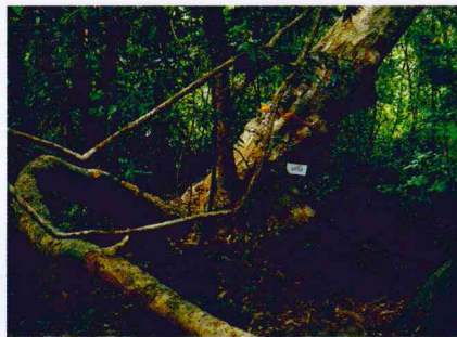
ต้นมะค่าโมงแสนงามในบริเวณป่าดิบสมบูรณ์