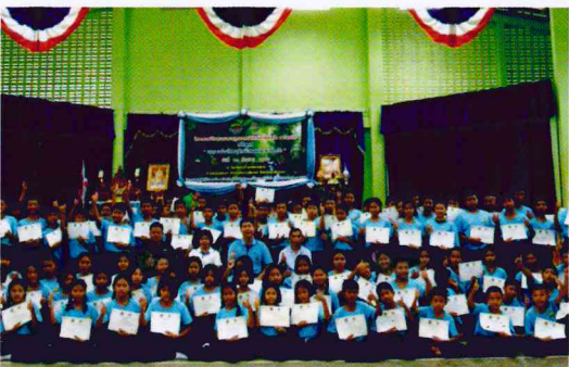
สำนักจัดการทรัพยากรป่าไม้ที่ 9 สาขาปราจีนบุรี

สงป. 9 สาขาปราจีนบุรี จัดอบรมราษฎรอาสาพิทักษ์ป่าร้อยต่อ 5 จังหวัด ทักษะสูตร “เยาวชนร่วมใจอนุรักษ์ป่าร้อยต่อ 5 จังหวัด ” โดยมีนักเรียนจากโรงเรียนบ้านคลองอุดม ต.ทุ่งพระยา อ.สนามชัยเขต จ.ฉะเชิงเทรา จำนวน 100 คน เข้ารับการฝึกอบรมความรู้เกี่ยวกับป่า ร้อยต่อ 5 จังหวัด ความรู้เกี่ยวกับช้างป่า ฯลฯ