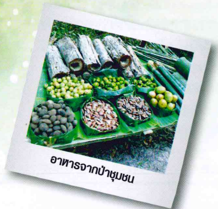
อาหารจากป่าชุมชน