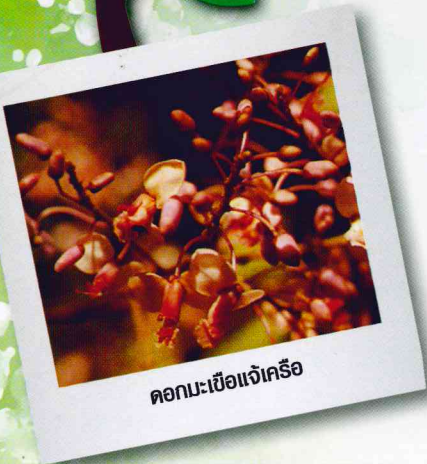
ดอกมะเขือแจ้เครือ

ป่าชุมชนบ้านตลาดขี้เหล็ก ตั้งอยู่หมู่ที่ 1 ตำบลแม่โป่ง อำเภอดอยสะเก็ด จังหวัดเชียงใหม่