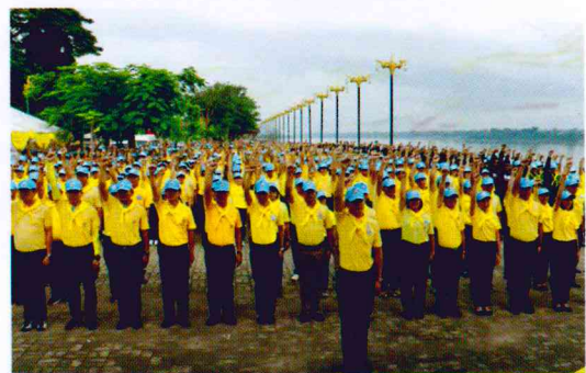
สำนักจัดการทรัพยากรป่าไม้ที่ 6 สาขานครพนม

สอป. 6 สาขานครพนม จัดเจ้าหน้าที่เข้าร่วมกิจกรรมจิตอาสา เราทำความดีด้วยหัวใจ ร่วมทำความสะอาดและปรับแต่งภูมิทัศน์เมืองนครพนม ตั้งแต่บริเวณแลนด์มาร์คพญาศรีสัตตนาคราช เรื่อยไปตามเส้นทางริมแม่น้ำโขงจนถึงสะพานมิตรภาพแห่งที่ 3 นครพนม – คำม่วน ระยะทาง 13 กิโลเมตร