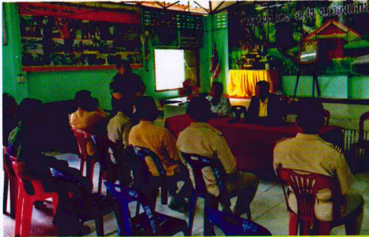
สำนักจัดการทรัพยากรป่าไม้ที่ 2 (เชียงราย)

นายสมศักดิ์ เจียมสงวนวงศ์ พอ.สำนักฯ พร้อมด้วย พอ.ศูนย์ป่าไม้เชียงราย ผู้ตรวจราชการกรมป่าไม้ ลงพื้นที่ติดตามผลการดำเนินงานโครงการจัดที่ดินทำกินให้ชุมชน (คทช.) ในพื้นที่ป่าสงวนแห่งชาติ ป่าแม่ืองพั้งขวา และป่าแม่เงาว ท้องที่บ้านปางปอ หมู่ 1 ต.ปอ อ.เวียงแก่น จ.เชียงราย