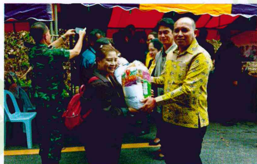
สำนักจัดการทรัพยากรป่าไม้ที่ 13 สาขานราธิวาส

สงป.ที่ 13 สาขานราธิวาส โดยหน่วยป้องกันรักษาป่าที่ ยล.3 (อำเภอยะบันนังสตา-ฮาสา) ร่วมออกหน่วยบริการประชาชนอำเภอ ยิมเคลื่อนที่ กับส่วนราชการในพื้นที่โดยประชาสัมพันธ์ทางด้านป่าไม้ สร้างความเข้าใจ และขอความร่วมมือ ในด้านการป้องกันรักษาป่า ณ ป้อมชุมชนรักษาความปลอดภัยหมู่บ้าน หมู่ที่ 4 บ้านติตะ ต.ถ้าทะลุ อ.บันนังสตา จ.ยะลา