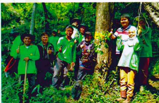
สำนักจัดการทรัพยากรป่าไม้ที่ 4 สาขาพิษณุโลก

กรมป่าไม้ โดยหน่วยป้องกันรักษาป่าที่ พช 10 (ตะมะ) ร่วมกับราษฎรบ้านบุดนวน หมู่ที่ 1 ต.น้ำร้อน อ.เมืองเพชรบูรณ์ จ.เพชรบูรณ์ ทำพิธีบวชป่า และปลูกต้นไม้ บริเวณป่าชุมชนบ้านบุดนวน ในเขตป่าสงวนแห่งชาติป่าห้วยกันและป่าคลองติบ