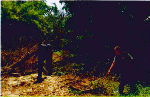
สำนักจัดการทรัพยากรป่าไม้ที่ 7 (ขอนแก่น)

สงป. 7 (ขอนแก่น) โดยศูนย์ป่าไม้ร้อยเอ็ด มอบหมายให้หน่วยป้องกัน และพัฒนาป่าไม้ หนองพอก ออกปฏิบัติการกิจช่วยเหลือฟื้นฟู สภาพสิ่งแวดล้อม ภายหลังจากน้ำล้น ณ โรงเรียน บ้านท่าเยี่ยม ต.วังหลวง อ.เสลภูมิ จ.ร้อยเอ็ด โดยร่วมกันทำความสะอาดเก็บกวาดกิ่งไม้ ใบไม้ วัชพืช ตัดทอนไม้ที่โค่นล้ม ตัดแต่ง กิ่งไม้ เพื่อไม่ให้กีดขวางอาคารสถานที่ภายในโรงเรียน