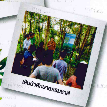
เดินป่าศึกษาธรรมชาติ