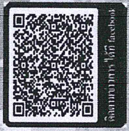
ติดตามข่าวสารได้ที่ facebook