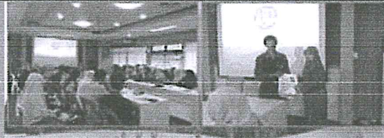
ส่วนจัดการทรัพยากรธรรมชาติและสิ่งแวดล้อม 23:05