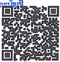
QRcode สำหรับ Download เอกสาร

ผู้อำนวยการสำนักจัดการทรัพยากรป่าไม้ที่ ๑๓ (สุราษฎร์ธานี)