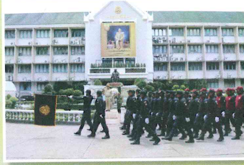
กรมป่าไม้ กรมอุทยานแห่งชาติฯ และกรมทรัพยากรทางทะเลและชายฝั่ง ร่วมจัดกิจกรรมเนื่องในวันเจ้าหน้าที่พิทักษ์ป่าโลก