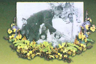
ต้นไม้ทรงปลูก

ปีที่ 14 ฉบับที่ 165 ประจำเดือนสิงหาคม พ.ศ. 2561