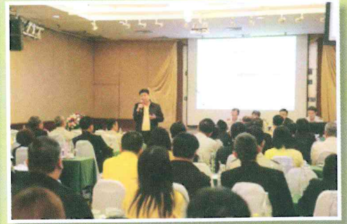
การประชุมเพื่อปฏิรูปและแก้ไขปัญหาเร่งด่วนด้านทรัพยากรธรรมชาติและสิ่งแวดล้อมตามนโยบายรัฐบาลในพื้นที่จังหวัดเชียงราย