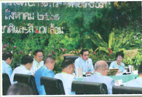
นายกรัฐมนตรี เป็นประธานการประชุมหัวหน้าส่วนราชการระดับกระทรวงหรือเทียบเท่า ครั้งที่ 3/2561