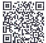
QR Code กระทรวงทรัพยากร ธรรมชาติและสิ่งแวดล้อม

กองพัฒนาระบบราชการ 1 โทร. 0 2356 9999 ต่อ 8953 โทรสาร 0 2281 8248