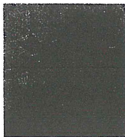
รูปรถเข็นนั่งใช้ไฟฟ้า รุ่น KM

บริษัทฯ รับประกันรถเข็นนั่งใช้ไฟฟ้าเป็นเวลา 1 ปี รวมค่าบำรุงรักษา และซ่อมแซมแก้ไข