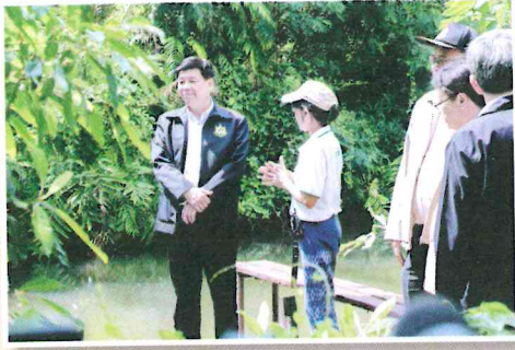
รมว.ทส. ลงพื้นที่ “คู้งบางกะเจ้า” เยี่ยมชมศูนย์การเรียนรู้พื้นที่สีเขียวฯ และร่วมเวทีเสวนากับผู้นำชุมชน