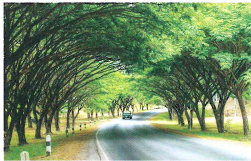
ถนนอุโมงค์ต้นไม้จามจุรี ม.สุรนารี

อุโมงค์ต้นไม้จามจุรี ภายในมหาวิทยาลัยเทคโนโลยีสุรนารี (มทส.) จ.นครราชสีมา เส้นทางที่จะมุ่งหน้าไปยังฟาร์มของมหาวิทยาลัย ภาพแนวต้นไม้สูงโค้งตัวเข้าหากันปกคลุมถนนมองดูคล้ายอุโมงค์ขนาดย่อม โดยเฉพาะช่วงโค้งของถนนจะเป็นภาพงามน่าประทับใจ เป็นจุดที่มีผู้นิยมมาถ่ายภาพ Pre-Wedding กันมาก