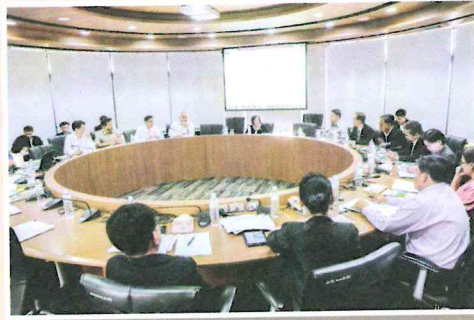
การประชุมคณะกรรมการพัฒนา ปรับปรุงแก้ไขเพิ่มเติมกฎหมายว่าด้วยการป่าไม้ให้ทันสมัยและเป็นปัจจุบัน