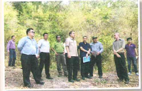
การประชุมคณะกรรมการและคณะทำงานจัดงานโครงการป่านิเวศ ณ เขื่อนผาแดง อ.แม่สอด จ.ตาก

10 พฤษภาคม 2561 พลเอกสุรศักดิ์ กาญจนรัตน์ รัฐมนตรีว่าการกระทรวงทรัพยากรธรรมชาติและสิ่งแวดล้อม พร้อมด้วยผู้บริหารข้าราชการ เจ้าหน้าที่ในสังกัด เดินทางมาตรวจเยี่ยมศูนย์การเรียนรู้พื้นที่สีเขียวเชิงนิเวศนครเขื่อนขันธ์ และเสวนาร่วมดูแลพื้นที่สีเขียว “คู้งบางกะเจ้า” อย่างมีส่วนร่วมและยั่งยืน ณ ต.บางกระเจ้า จ.สมุทรปราการ เปิดเวทีเสวนาร่วมดูแลพื้นที่สีเขียว “คู้งบางกะเจ้า” อย่างมีส่วนร่วมและยั่งยืน เพื่ออนุรักษ์ความหลากหลายทางชีวภาพ พันธุ์พื้นที่สีเขียวในคู้งบางกะเจ้า และดำรงรักษาวิถีเกษตรดั้งเดิมและภูมิปัญญาท้องถิ่นที่ทรงคุณค่า ให้เป็นแหล่งเรียนรู้สำหรับคนเมืองและเป็นต้นแบบของการพัฒนาป่าในเมือง