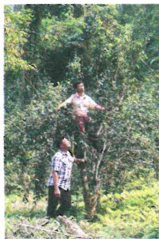
ชาอัสสัมต้นจิว อายุ 500 ปี

ต้นชาอัสสัม ต้นนี้อายุยืนถึง 500 ปี บรรพบุรุษชาวไทลื้อนำเข้ามาปลูกเพื่อนำใบชามาทำใบเมี่ยงแต่ราคาไม่ดี พวกเขาเลยเปลี่ยนมาเก็บยอดอ่อนแทนใบจนกลายมาเป็นดินแดนชาอัสสัมอันเลื่องชื่อ ณ บ้านศรีนาบ้าน ต.เรื่อง อ.เมือง จ.น่าน