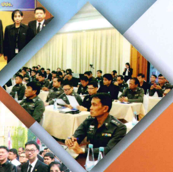
กองกำกับการสืบสวนตำรวจภูธรจังหวัดขอนแก่น Investigation Sub-Division Khonkaen Provincial Police