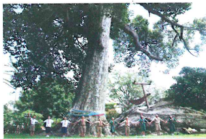
ยายักษ์แห่งวัดยาง

ต้นยางนา ว่ากันว่ายางนาที่อยู่ภายในวัดยาง อ.เมืองลพบุรี ต้นนี้ มีอายุราว 300-400 ปี อยู่มาก่อนมีวัดเสียอีก แต่ก่อนมีกิ่งก้านใหญ่ทอดยาวแต่ได้หักโค่นลงไปตามกาลเวลา ลูกยางที่ร่วงหล่นยังเป็นของเล่นและรายได้เสริมให้เด็กๆ นำไปขายแก่ผู้สนใจด้วย