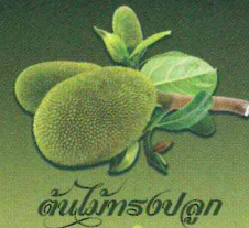
ต้นไม้ทรงปลูก

ในพระบาทสมเด็จพระปรมินทรมหาภูมิพลอดุลยเดช บรมนาถบพิตร