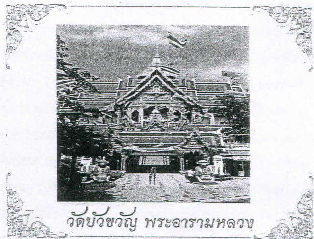
วัดบวรวิญญู พระอารามหลวง

ด้วย "ศาลปกครอง" ได้รับพระมหากรุณาธิคุณโปรดเกล้า ฯ พระราชทานผ้าพระกฐินให้นำไปถวายพระสงฆ์จำพรรษา ณ พระอารามหลวงต่าง ๆ เป็นประจำทุกปี ซึ่งพิธีถวายผ้าพระกฐินพระราชทานนี้ จัดเป็นประเพณีบุญและพิธีที่สำคัญทางพระพุทธศาสนา โดยถวายผ้าพระกฐินฯ แต่พระสงฆ์ที่จำพรรษา ณ วัดนั้น ๆ ได้ปีละครั้ง ในการร่วมบำเพ็ญบุญและร่วมอนุโมทนา "กฐิน" นับว่าเป็นบุญมหากุศลเป็นอันมาก ซึ่งพุทธศาสนิกชนทั้งหลายได้ปฏิบัติสืบต่อกันมา