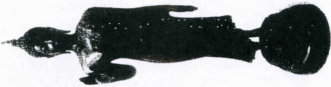
สำเนาถูกต้อง

โทรศัพท์ ๐ ๒๒๒๖ ๕๘๐๐ ต่อ ๒๒๕๕, ๒๒๕๘, ๒๒๐๕, ๒๒๐๗ โทรสาร ๐ ๒๒๗๓ ๙๔๐๘