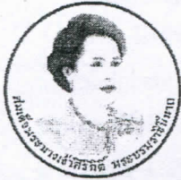
ด้านหน้า

เนื่องในโอกาสพระราชพิธีมหามงคลเฉลิมพระชนมพรรษา ๗ รอบ ๑๒ สิงหาคม ๒๕๕๙