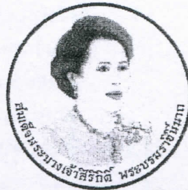
ด้านหน้า