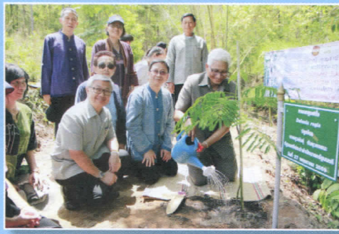
รมต.สุวัณษ์ ลงพื้นที่จังหวัดเชียงใหม่ ติดตามความก้าวหน้าโครงการโฉนดที่ดินชุมชนบ้านแม่ทา พร้อมเยี่ยมชมพื้นที่โครงการ