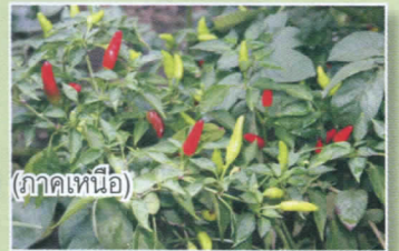
(ภาคเหนือ)