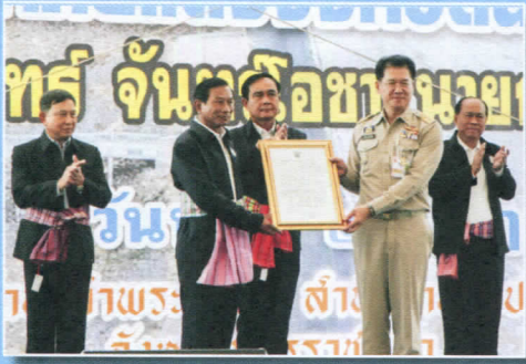
นายกรัฐมนตรี ตรวจราชการการดำเนินงานตามนโยบายของรัฐบาล จ.นครราชสีมา พร้อมเป็นสักขีพยานการมอบหนังสือโฉนดชุมชน