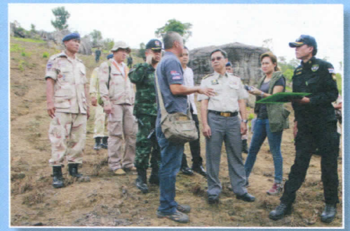
อธิบดีกรมป่าไม้ สนธิกำลังเจ้าหน้าที่กว่า 200 นาย ลุยยึดคืนผืนป่าต้นน้ำ จ.เลย หลังพบกลุ่มนายทุน บุกรุกปลูกลายพาราและปาล์มน้ำมัน

25 พฤษภาคม 2559 พลเอก ประยุทธ์ จันทร์โอชา นายกรัฐมนตรี เดินทางตรวจราชการการดำเนินงานตามนโยบายของรัฐบาล ในพื้นที่ จ.นครราชสีมา ในโอกาสนี้ นายกรัฐมนตรีให้เกียรติเป็นสักขีพยาน ในการมอบหนังสืออนุญาตให้เข้าทำประโยชน์ในเขตป่าสงวนแห่งชาติ ป่าครบุรี เพื่อจัดที่ดินทำกินให้ชุมชน ตามนโยบายรัฐบาล (คสช.) และหนังสือแสดงโครงการป่าชุมชน ท้องที่ อ.ครบุรี อ.เสิงสาง และ อ.ปักธงชัย จำนวน 11 แปลง