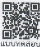
แบบทดสอบ