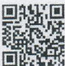
เอกสารแนบ ๑

ปฏิบัติราชการแทนปลัดกระทรวงทรัพยากรธรรมชาติและสิ่งแวดล้อม