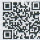
ตอบรับเข้าร่วมประชุม