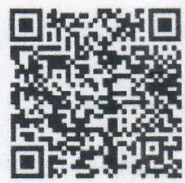
แบบตอบรับรายงาน