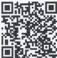
ดาวน์โหลดเอกสาร

เลขาธิการป่าไม้ชำนาญการพิเศษ รักษาการแทน ผู้อำนวยการสำนักงานจัดการทรัพยากรป่าไม้ที่ ๕ (สระบุรี)