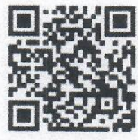
แบบฟอร์มฯ