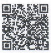
โครงการ/กำหนดการ/ใบสมัคร