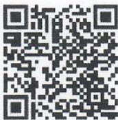
เอกสารแนบ

ผู้อำนวยการป่าไม้ชำนาญการพิเศษ รักษาการแทน ผู้อำนวยการสำนักจัดการทรัพยากรป่าไม้ที่ ๕ (สระบุรี)