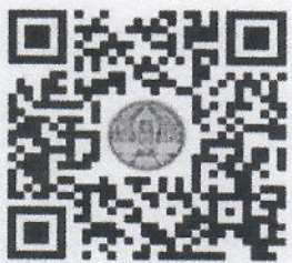
ดาวน์โหลด QR Code