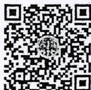
แบบรายงาน