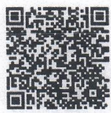
รายงานสถิติ ประจำเดือน ธ.ค.๖๕

หน้าห้อง สจป.ที่ ๕ (สระบุรี) เลขที่รับ 695 วันที่ 30 ม.ค. 2566 เวลา 14:51:24