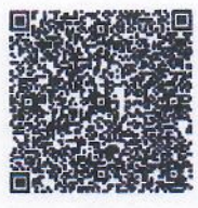
หมายเลข ๑