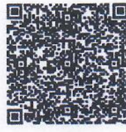
หมายเลข ๒