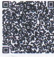
หมายเลข ๓