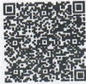
แบบรายงาน

นักวิชาการป่าไม้ชำนาญการพิเศษ ผู้อำนวยการส่วนอำนาจการ