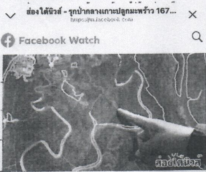
ส่องได้นิวส์ 23 มีนาคม 2018 เวลา 02:44 น.

รุกป่ากลางเกาะปลุกมะพร้าว 167 ต้นอายุไม่น้อยกว่า 20 ปี สูญ/รุกป่ากลางเกาะปลุกมะพร้าว 167 ต้นอายุไม่น้อยกว่า 20 ปี คิด ชายแดนไทย-มาเลเซีย หนึ่งในแผนปฏิบัติการทางดิน พลิกฟื้นผืนป่า ชายเลนตลอดครั้งที่ 2 ..... เพิ่งเติม 18 · แชร์ 3 ครั้ง ถูกใจ แสดงความคิดเห็น แชร์