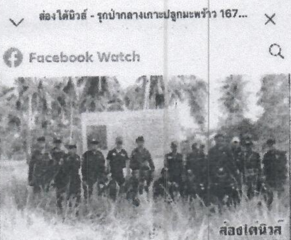
ส่องได้นิวส์ 22 มีนาคม 2018 เวลา 02:14 น.