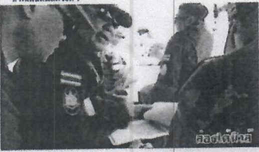
ส่องได้นิวส์ 23 มีนาคม 2018 เวลา 02:14 น.

รุกป่ากลางเกาะปลุกมะพร้าว 167 ต้นอายุไม่น้อยกว่า 20 ปี สูญ/รุกป่ากลางเกาะปลุกมะพร้าว 167 ต้นอายุไม่น้อยกว่า 20 ปี คิด ชายแดนไทย-มาเลเซีย หนึ่งในแผนปฏิบัติการทางดิน พลิกฟื้นผืนป่า ชายเลนตลอดครั้งที่ 2