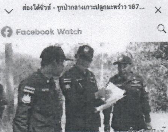
ส่องได้นิวส์ - รุกป่ากลางเกาะปลุกมะพร้าว 167... https://m.facebook.com