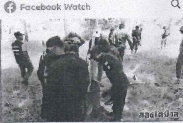
ส่องได้นิวส์ 25 มีนาคม 2018 เวลา 02:44 น.

รุกป่ากลางเกาะปลุกมะพร้าว 167 ต้นอายุไม่น้อยกว่า 20 ปี สูญ/รุกป่ากลางเกาะปลุกมะพร้าว 167 ต้นอายุไม่น้อยกว่า 20 ปี คิด ชายแดนไทย-มาเลเซีย หนึ่งในแผนปฏิบัติการทางดิน พลิกฟื้นผืนป่า ชายเลนตลอดครั้งที่ 2 ..... เพิ่งเติม 18 · แชร์ 3 ครั้ง ถูกใจ แสดงความคิดเห็น แชร์