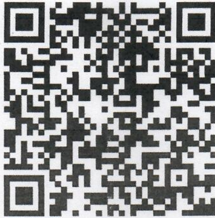
QR Code ระเบียบคณะกรรมการฯ ๒๕๖๕