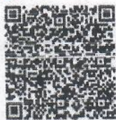
แบบฟอร์ม ยื่นคำของบประมาณ ประจำปี 2567