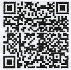
QR CODE ไฟล์ข้อมูล

วิชาการป่าไม้ชำนาญการพิเศษ ผู้อำนวยการส่วนอำนาจการ